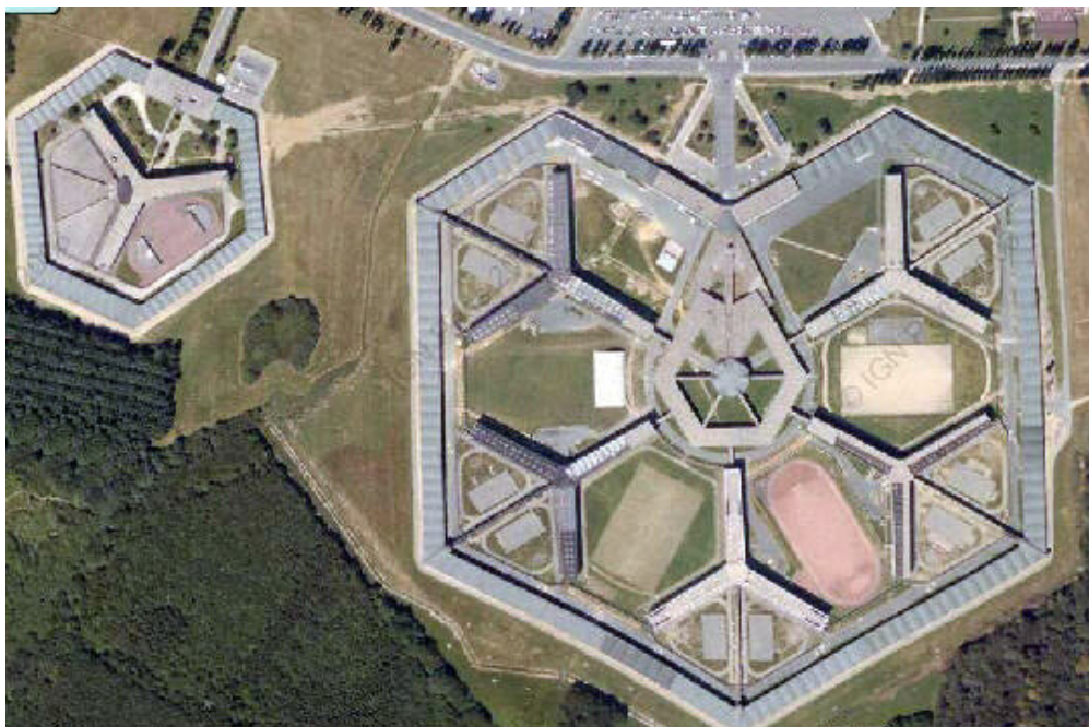
Foto: Prisión de Fleury-Mérogis; considerado uno de los complejos penitenciarios más grandes de Europa

En general el sistema penitenciario francés tiene una amplia orientación hacia la seguridad , entendida en una doble vertiente. Por un lado la seguridad de la sociedad mediante la función de vigilancia; por otro la seguridad individual de las personas que han sido puestas a su disposición.