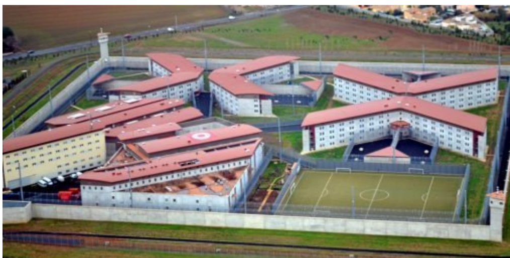
Foto: Vista aérea de la prisión de Béziers