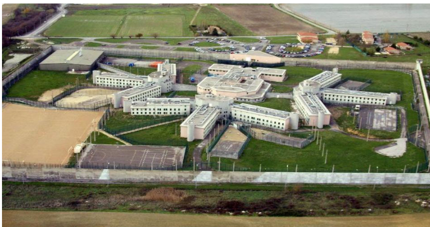
Foto: Vista aérea de la prisión d' Aix-Luynes